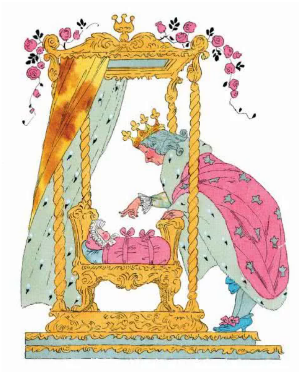
Сказка Спящая красавица