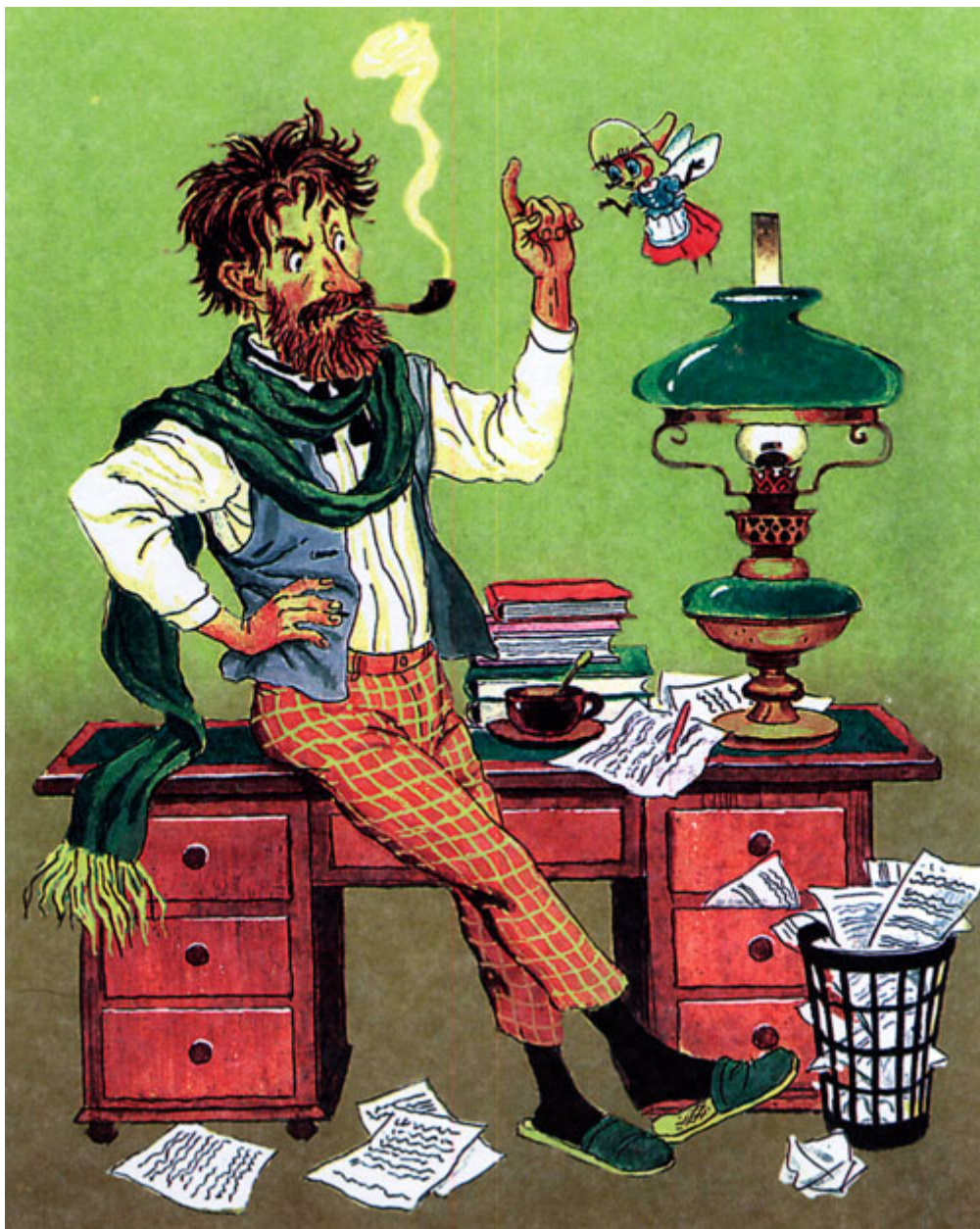
Сказка Хвосты (Бианки)